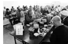
お昼もビールで乾杯

帰りのバスは、また飲み会場に変身。車中を盛り上げてくれたいつものベテランのガイドさんと、安全運転をいただいた若い独身の運転手さんに心から感謝し、友達もたくさん出来、心をきれいにしてくれました。