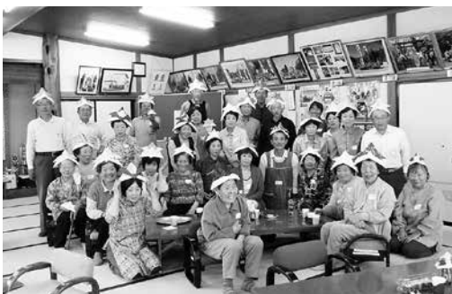
5月は兜の折り紙で楽しみました

9月25日(土)と2月19日(日)、YOU遊ランド屋内ゲートボール場で、第18回秋季交流ゲートボール大会と、第22回健康維持交流冬季ゲートボール大会が、共に15チーム参加で行われました。