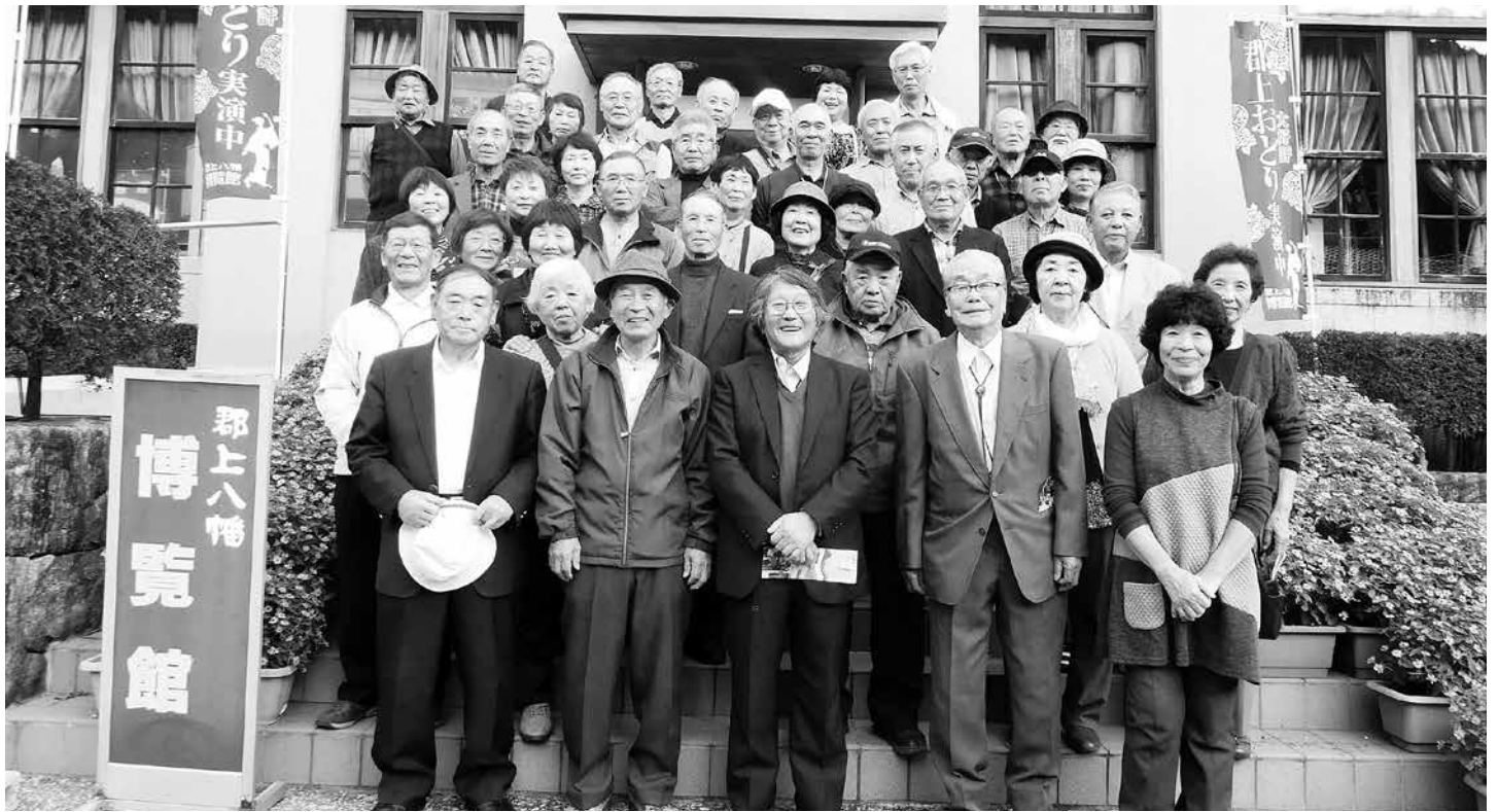
平成 29 年度研修旅行、岐阜県郡上八幡市にて

第 48 号 平成 30 年 3 月 25 日 発行所 高山村老人クラブ連合会 編集 教養部 題字 勝山一男 印刷所 株式会社 オフセット