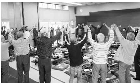
盛大に出来た交流会、最後は万歳

白と黒のチームに分かれ、マス目の角が凹んだ専用マットをめぐって、スティックで交互にボールを打ち5目並べをしますが、相手チームに邪魔されたりマス目の凹みに入らなかつたりと、なかなかうまくいきません。それでも中には5つ並ぶチームも出て、その度に歓声が上がっていました。