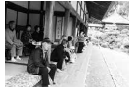
龍潭寺で庭の説明に聞き入る

午後1時ごろ、女城主直虎ゆかりの龍潭寺に到着。早朝からずっとバスの中だったためか、見事な庭園をゆっくり見て回ると、何か心がゆったりと