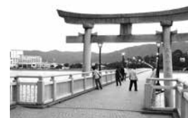
竹島からの帰り道

静かになってきました。NHK大河ドラマ館も見学した後観光みかん園へ。早速みかん狩りが始まりました。いくら食べ放題といってもそんなに沢山食べられるものではないと思っていたら、中には8個も食べた人がいてびっくり。ホテルには予定より早く着いたので、目の前に浮かぶ天然記念物の竹島に散歩に出かけました。島から、海に沈む夕陽を眺めてホテルに戻ると、間も