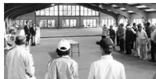
秋季ゲートボール大会開会式