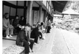
龍潭寺で庭の説明に聞き入る

午後1時ごろ、女城主直虎ゆかりの龍潭寺に到着。早朝からずっとバスの中だったためか、見事な庭園をゆつくり見て回ると、何か心がゆつたりと