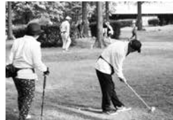
県老連大会出場を掛け熱戦

今年から県老連の大会が、中・南信会場と東・北信会場の2ヶ所で開催されることになり、この日は県老連大会への出場権をかけた大会となりました。