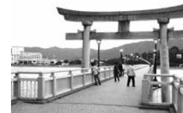
竹島からの帰り道

ホテルには予定より早く着いたので、目の前に浮かぶ天然記念物の竹島に散歩に出かけました。島から、海に沈む夕陽を眺めてホテルに戻ると、間も