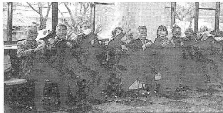
昨年開き好評だった、 かんな学級での健康 教室

湯にいくセンターの 送迎バスは、各地区の 公民館前などを正午 午後0時40分に停車。