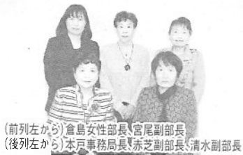
(前左から)倉島女性部長、宮尾副部長 (後列左から)本戸事務局長、赤芝副部長、清水副部長