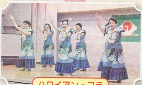
ハワイアン・フラ