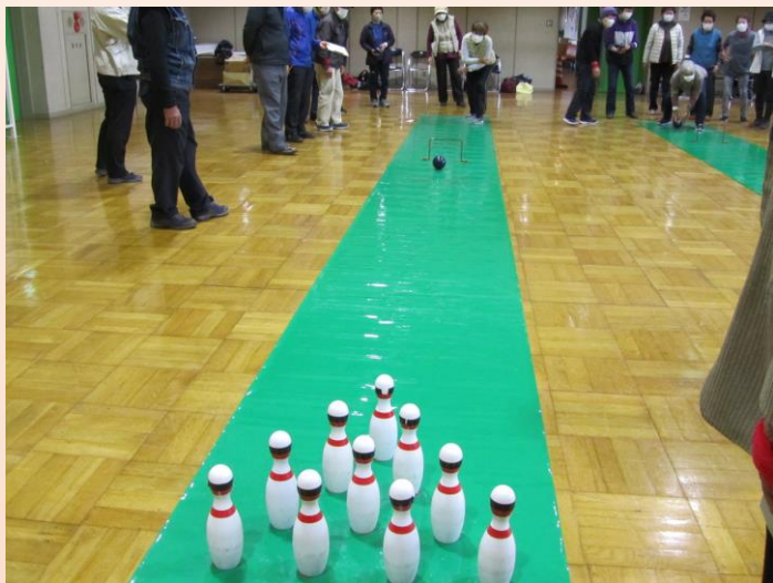
スマイルボーリング