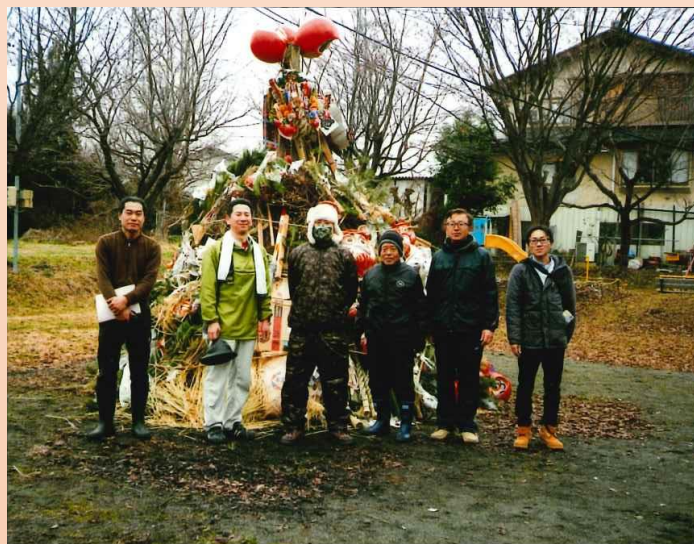
どんど焼きのお手伝い