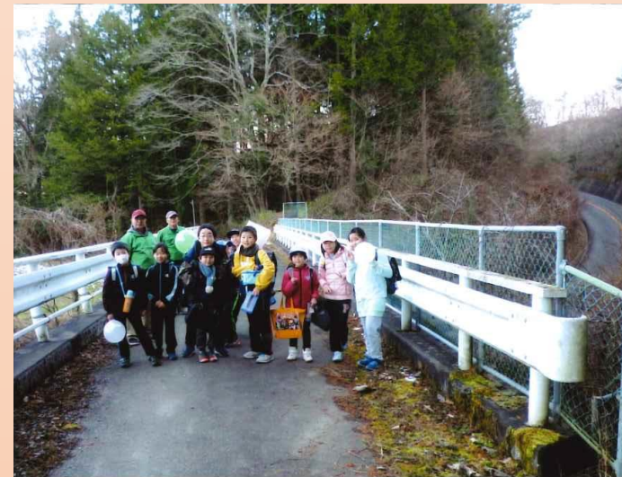
あいさつ運動と見守り