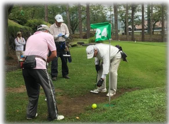
男女問わず大人気の 「マレットゴルフ」

仲間と一緒に健康で充実した日々の生活を楽しみましょう。 〇〇〇〇クラブに、ぜひご参加ください。