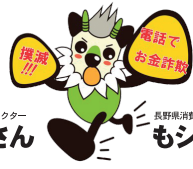
長野県消費者被害防止啓発キャラクター もシカっち