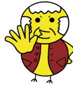
電話でお金詐欺防止キャラクター ピジいさん