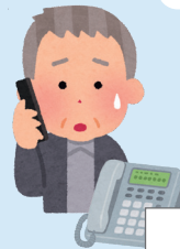
特殊詐欺対策アダプタ