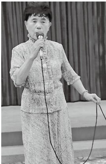
歌唱も趣味の一つ

mの清里駅前の草原で皆さんと背負うほどのワラビを採り、楽しい高原列車の旅になりました。近所の方から、嫁入り前の娘に着物の仕立てを教えて欲しいと頼まれ、短期間娘さんたちが通いにきました。自分で縫った浴衣を夏祭りに着た姿は、親御さんとともに喜ばしい気持ちになりました。佐久は養蚕業が盛んで、役所の友人に誘われ蚕の鑑別手の技能を「上田蚕種」で習得し、資格証をいただきました。川上、南相木、八千穂と3日ほど鑑別手として養蚕家に赴き、喜ばれ楽しいひとときでした。冬はスキーに、湯の丸から池の平へ快適に滑降りスキーを肩に疲れも忘れしました。春は出会いの時。木曾福島に