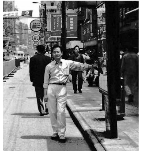
若い頃、海外出張先にて

自動運転、危険回避アシストなど技術革新が進んでいます。年齢を重ねるごとに、いろいろな機能が低下します。運転技能向上を図るより、安全走行機能装備車両限定免許などの交通法の改正が望ましいと思われまます。