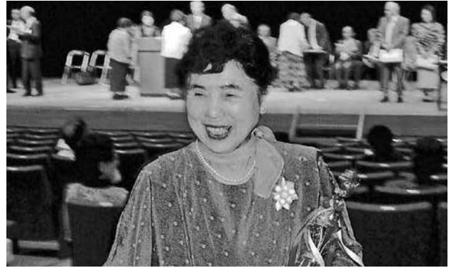
優勝トロフィーを胸に溢れる笑顔

赤い丸ポストに「義仲くん」「巴ちゃん」「お代官様」「清明くん」「ひのきちゃん」と、福島町ならではと感心。上松のトロッコ電車に乗り、紅葉の美しい赤沢美林へ。スキーは御嶽山、福島藪原も快適でした。地域の方々も優しく、時には野菜や山羊の乳までもいただきました。