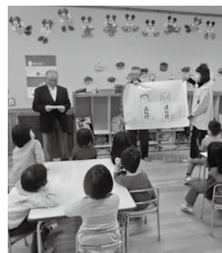
園児とのふれあいのとき

③行政への協力 村が主催する敬老会について、各単位クラブが参加者の取りまとめを行っている