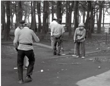
男性の参加者が多いマレットゴルフ

何はともあれ、コロナの世相の中でも積極的に活動できたことは大きな収穫だと思っています。