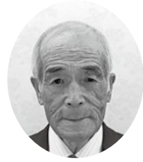
県シニア連会 長 嘉 藤岡

一昨年1月に発した新型コロナウイルス感染症は、デルタ株からオミクロン株に置き換わり、感染者数が年明け早々から爆発的に増加し、過去最高の陽性者数を記録するなど、高齢者の生活が抑制される日々が続いています。