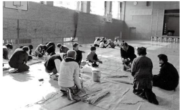
王滝小学校の「しめ縄集会」に参加指導