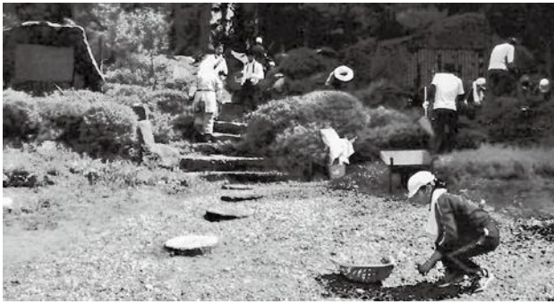
中学生と協働の「慰霊碑」清掃奉仕活動