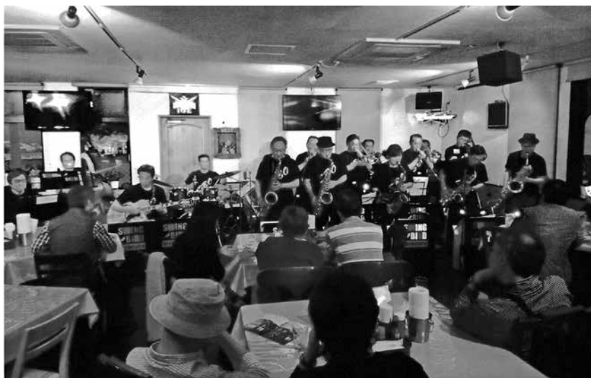
趣味の音楽活動の様子。仲間との楽しいひととき。

間、数多くの方達と関わりご教授いただきました。特に海外出張——中国・ベトナム・台湾——は貴重な体験ができたと思います。郷に入れば郷に従えといいますが、ベトナムでのこと、青森から来ていたスタッフと現地人が夜釣りに出かけ、日本人だけが蚊に刺されまくりました。違いは食べ物にありました。