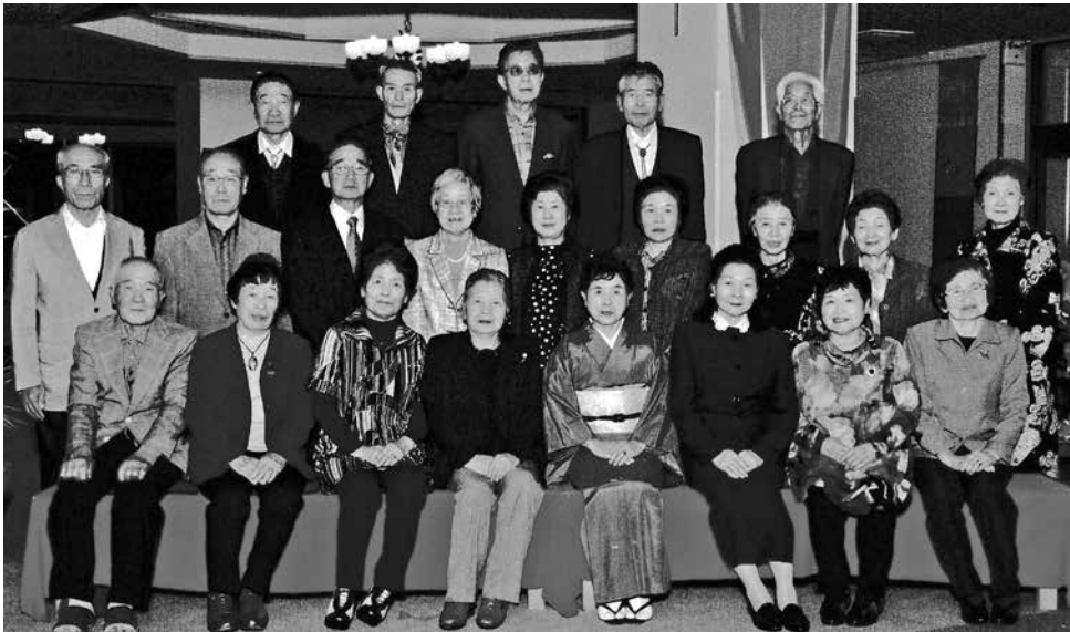
同級生と一緒に「喜寿の祝い」の記念写真

清掃・アクセス道の花壇の手入れを積極的に行い、クラブ大会では博識の講師の講演で貴重な知識をいただきました。これまで会った多くの方々や、指導していただいたみなさんに感謝し、ご健康とご活躍をお祈りします。