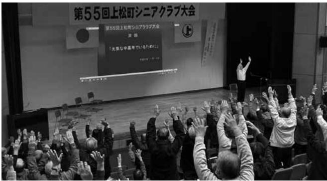
第55回上松町シニアクラブ大会の様子

大会を開催。既に56回を数えませんが、功労者の表彰等を行い、コミュニケーションを図っております。また、昨年は町内の整骨院の院長さんを招き、高齢者の健康づくりの講演会を開催し、会員の皆さんの好評を得ました。ただ、会員の好評を得る大会を開催することは難しく、大きな悩みとなっています。