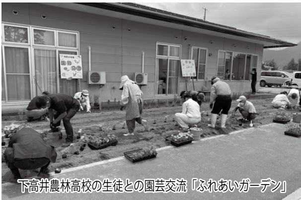
下高井農林高校の生徒との園芸交流「ふれあいガーデン」

隣接のデイサービスの利用者にも好評でよく観に来てくれたと聞いており、大変嬉しく思いました。暑くなり、雑草が伸び