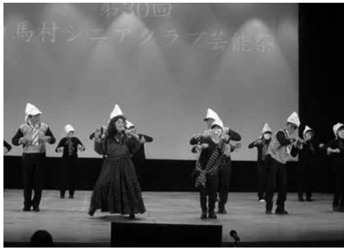
いきいきと日ごろの活動の成果を発表「芸能祭」

白馬村は北部山沿い地方であり、雪の多いところでもあります。白馬岳、杓子岳、白馬鎚ヶ岳の麓でもあります。白馬岳の頂上においては富山県との境そして蓮華岳では富山県、新潟県との3県境でもあります。冬期間スキー場への来村者は約100万人グリーンシーズンにおいて約80万人の方々から来ていただき観光地として白馬村全体で今以上に発展を目指しているところでもあります。