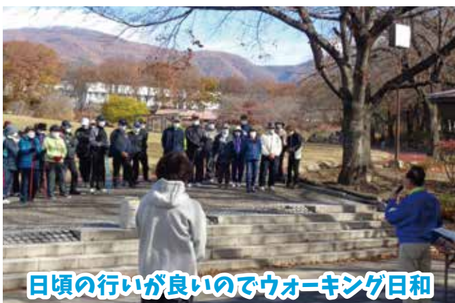
日頃の行いが良いのでウォーキング日和