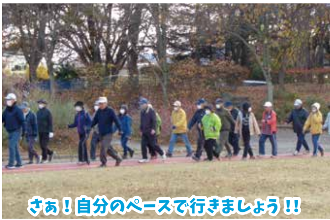
さあ!自分のペースで行きましょう!!