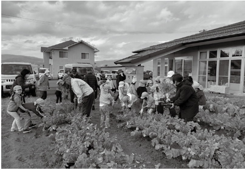
沢山の野菜を収穫し調理して、皆で美味しくいただきました

始めると週1回の活動だけでは難しくなり、涼しいうちにと朝早くから草刈りもしました。しばらくの間草取りをマメにするのが大変でしたが、夏には沢山の野菜を収穫できました。収穫した野菜は、調理してみんなで美味しくいただきました。この他、マレットゴルフや老人ホームの草取りボランティア等活発な活動ができたと思います。今後も人のつながりを大切に、世代を超えて交流できる元気な地域であるよう、仲間と協力し老人クラブ活動を続けていこうと思っ