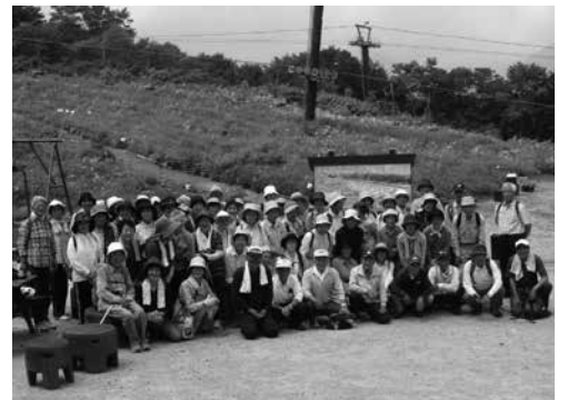
白馬五竜植物園で健康ウォーキング

事業計画では郷土めぐりの小旅行、健康ウォーキング、ゲートボール大会、男性の料理教室、健康講演会、まごころ募金、マレットゴルフ大会、手芸教室、芸能祭、スマイルボウリング大会、議員との懇談会、しめ縄づくりそしてデイサービスセンター