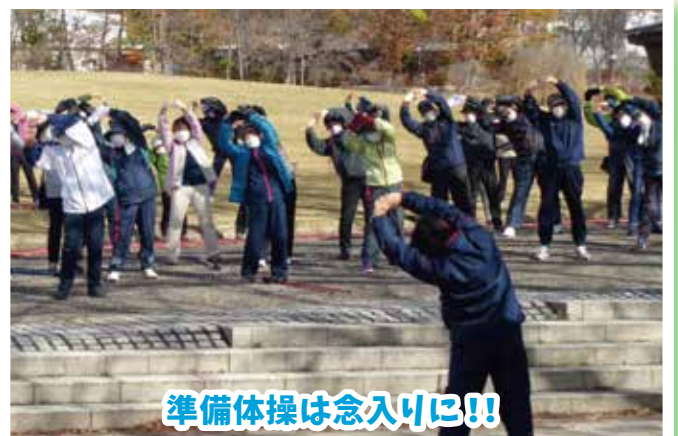
準備体操は念入り!!