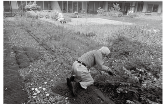
草取りボランティア活動