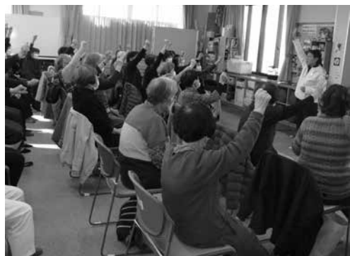
「わくわく♪ドキドキ若返り!!」体操

松本市高齢者クラブの傘下にある寿台双葉会は南部地区に位置しており、昭和52年「寿台老人クラブ」が結成され、平成6年「寿台双葉会」に名称変更して今年で30年になります。現在の会員は5クラブ154名で、5月上旬の体育館花壇の花植えを皮切りに年4回の「お茶会」、2回の「健康教室」、年が明けて新年会、総会が主な行事になっています。