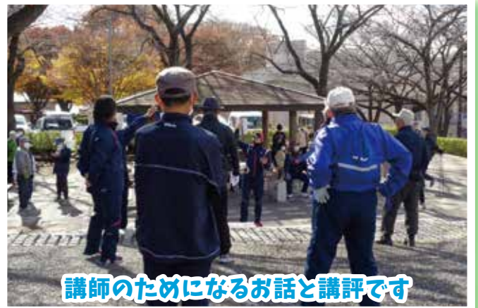
講師のためになるお話と講評です