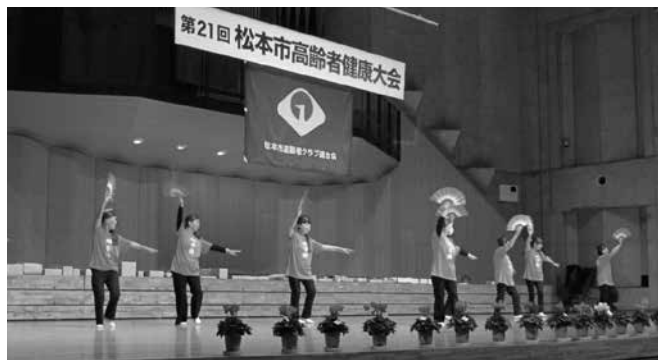
第21回松本市高齢者健康大会

また松本市高齢者クラブ主催のカラオケ大会、ゲートボール・ペタンク大会、作品展、健康大会（芸能発表会）にも積極的に参加しています。昨年はゲートボールの部で第4位入賞に輝き久々にカップを手にすることができました。 当地区の高齢化率は42%と高く、会員も年々高齢化する中、活動も制限されがちですが、これからも会員のみなさんの生きがいや健康づくりのために一人でも多くの方に参加していただけるよう工夫しながら取り組んでいきたいと思っております。