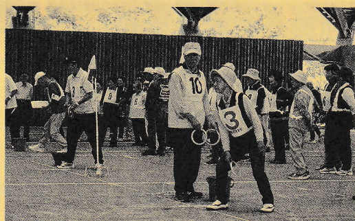
体育祭 輪投げ競技