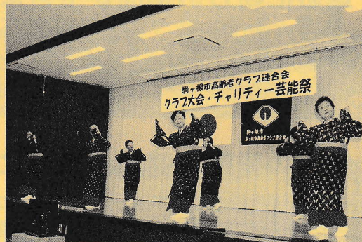
クラブ大会・チャリティー芸能祭