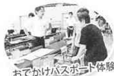
おでかけパスポート体験