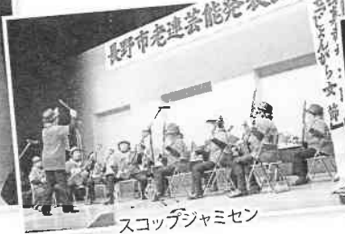
スコッチジャミセン