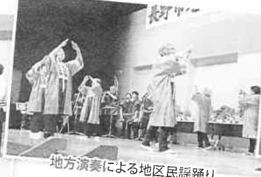
地方演奏による地区民謡踊り