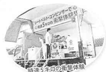
時速5キロの衝撃体験