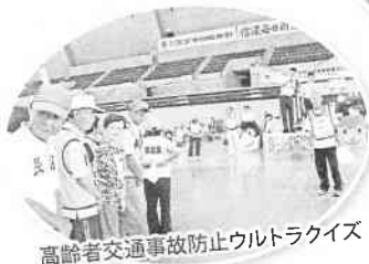
高齢者交通事故防止ウルトライズ