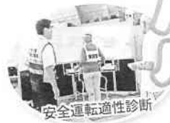
安全運転適性診断