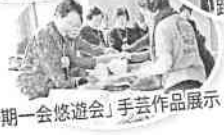
「一期一会悠遊会」手芸作品展示・販売