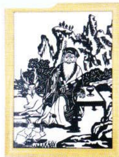
切り絵 (七福神より)