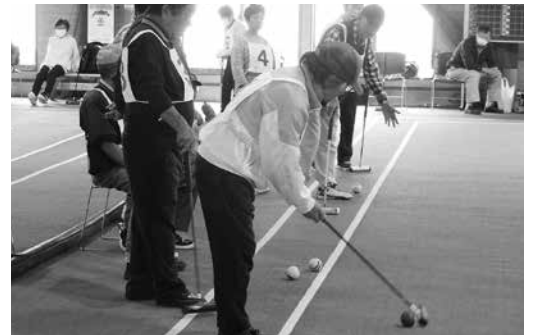
昨年の老連ゲートボール大会にて

花苗の植え付け及びその後の管理などの奉仕活動。 シルバー人材センターとの交流マレットゴルフ大会や寿ゲートボール大会、秋季及び冬季ゲートボール大会、マレット