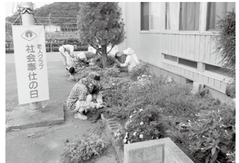
地区公民館周囲の草取り