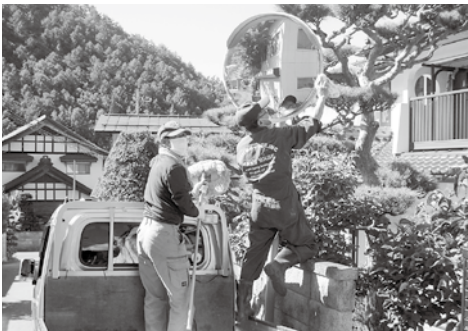
カーブミラー磨き