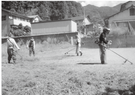
広場の草刈り作業