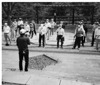
懇親会は中止となっても大勢参加

「いくつだった?」「たたき過ぎだ、アハハ」。 表彰式では、1位から3位、飛び賞、BB賞、ホールインワン賞、が発表され、名前が呼ばれるたびに大きな拍手と笑い声が沸き起こりました。ただ個人的には、昨年から採用された前年度上位者へのハッピーデーが大きく響き、好スコアでも入賞できず残念でした。