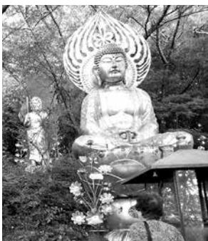
谷蔵寺の大きな金色の仏像