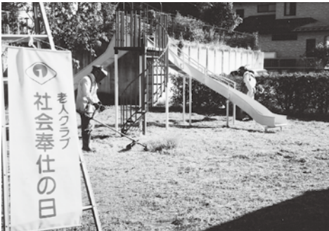
公園の草刈り作業