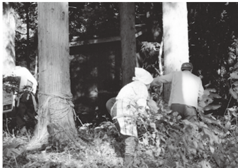
神社境内の草刈り