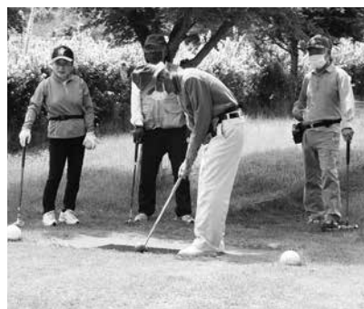
青空の下、花に囲まれ楽しく交流

両団体が入り混じっての班編成で、最高齢の89歳の方も含め皆さん元気はつらつでスタート。コースはアップダウンのあるチャオルの森の18ホール。「良いスタートじゃないか」「あっ、いけねえOBだぞ」「すごい！カップそば10cm」などの声があちこちから聞こえ、和気あいあいと楽しそうです。