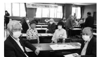
ブロック研修会場にて