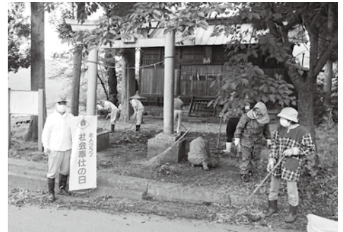
神社境内の美化活動