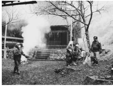
春の神社清掃活動

宮関老鷲会は、春と秋に行う皇大神宮、諏訪神社、地区の広場等の清掃、花いっぱい運動の、花壇とプランターの