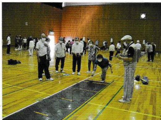
スマイルボウリング