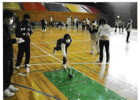
ファミリースマイルボウリング