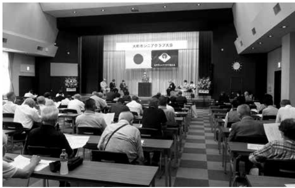
70名が出席したシニアクラブ大会

賀寿者へのお祝い時のエピソードが語られ、長寿と健康の大切さについての挨拶をいただきました。