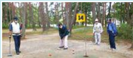
マレットゴルフ大会会開式/プレーの様子