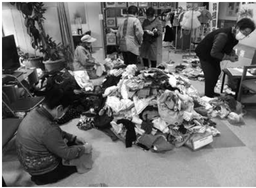
子供服の仕分けを行う女性部員

において令和3年12月6日(月)の午前中、15名の女性部の方々にご参加をいただき、大町市社会福祉協議会のお手伝いをさせていただきました。作業は子供服の仕分け作業です。これは「コアラのぽっけ」という名称で行われている事業で、不要になった子供服を持ち寄っていただき、それを無償で必要な方にお分け