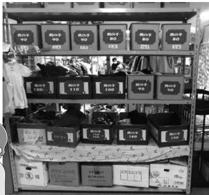
綺麗に整理できました

するといふもので、その集まった衣類の分類仕分けを行いました。約2時間、一生懸命作業をしていただき、かなりの量を行いました。今日は分は全体のほんの一部とお聞きし、びっくりいたしました。社協からも喜ばれ有意義な活動であったように思います。4年度も「続けて行いたいと思いますので、大勢の皆さんのご協力をお願いします。」