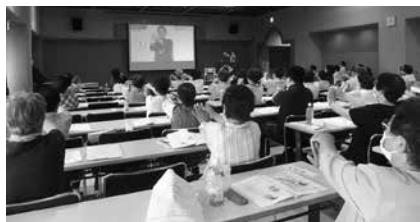
教わりながらストレッチする参加者