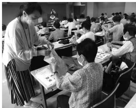
手と頭を使って作品を作る参加者

心も体も健康でいたいと感じ ました。次回も多くの女性 部の皆さんの参加を期待し ております。