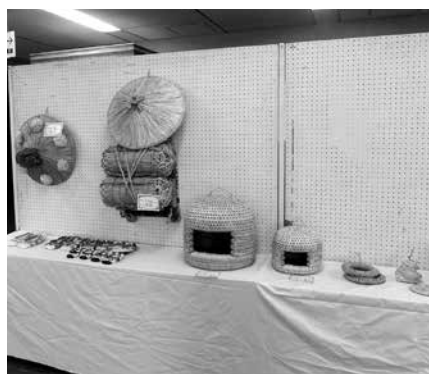
わら工芸の作品の数々

わら工芸に興味のある方、正月飾だけでもと思う方、気軽に事務局までお声がけください。皆さんの参加をお待ちしています。