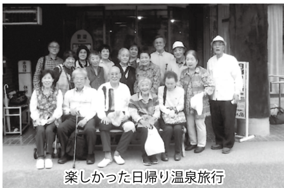
楽しかった日帰り温泉旅行

現在33名(男性10名、女性23名)の会員で活動しておりますが、有志による卓球・マージャン・カラオケ(コロナで休会中)は年間を通して週一回の機会をもって活動しており今後の会の運営も進んで入会して貰えるような魅力ある会にしたいものです。