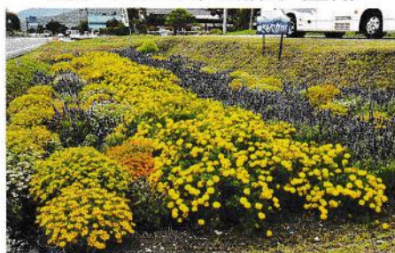
銀賞 塚原さわやかクラブ (穂高)