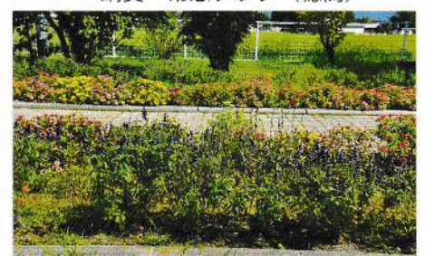
銅賞 古厩親睦会 (穂高)