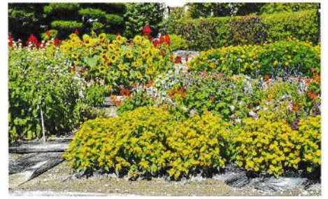
金賞 橋爪シニア倶楽部 (穂高)