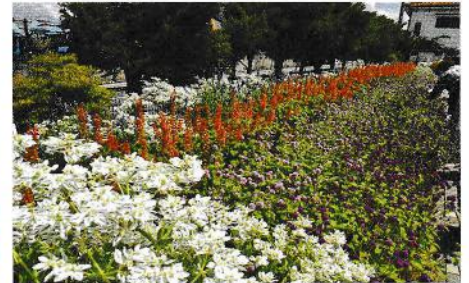
金賞 穂高町区愛好会 (穂高)