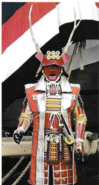
真田幸村の甲冑(穂高神社にて)

私は平日は自営業を営み、休日には、農家の仕事に励んだり、趣味の甲冑作りをしています。今までに製作した甲冑は、伊達政宗、真田幸村、真田昌幸、山雅カラーのグリーン甲冑など、全部で十体ほどあります。これらの甲冑を着て、各地のイベントやお祭りを盛り上げるお手伝いをしています。