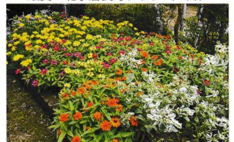
銀賞 宮城シニアクラブ (穂高)