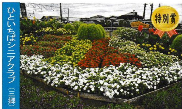
ひといちばシニアクラブ (三郷)