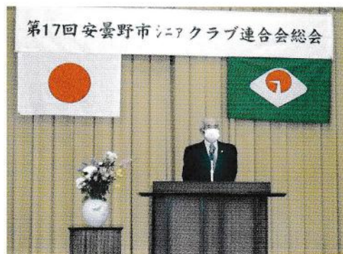
会長の総会あいさつ

高齢者である私達は、お互いに助け合いながら、楽しみを共有し、長寿の喜びを実感できる社会や、人間関係を築き上げて行きたい、努力したいと思えます。自然環境に恵まれたここ安曇野で何か一つでも、温もりのある地域作りに役立つことが出来たら、幸いと考えております。健康・友愛・奉仕、の三大運動を中心に明るく豊かな長寿社会づくりを目指して、勇気をもって行動して行きましょう。