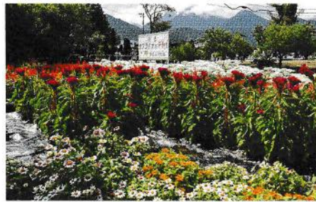
金賞 新屋三ツ矢会 (穂高)