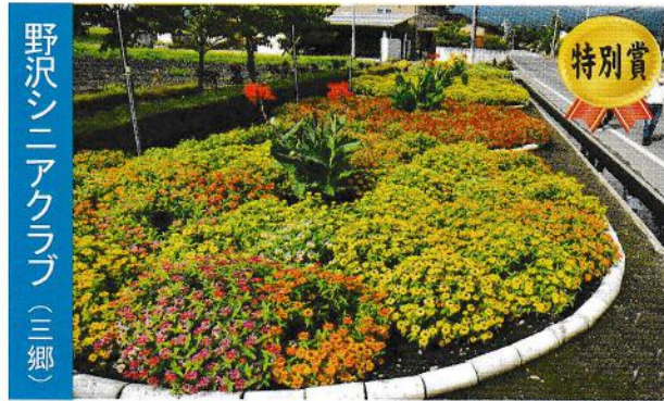
野沢シニアクラブ (三郷)