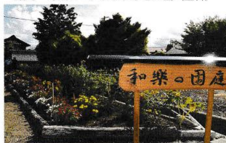
銅賞 新屋和楽会 (豊科)