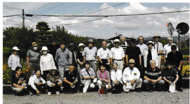
審査委員ほかの皆さん

銅賞…寺所シニアクラブひさご会・豊里しやくなげクラブ・常念クラブ・新屋和楽会・下長尾寿楽会・古厩親睦会