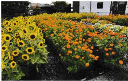
金賞 等々力町白寿会 (穂高)