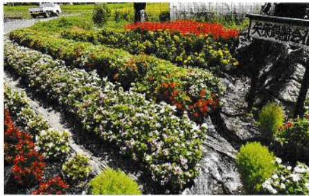
金賞 矢原鶴齢会 (穂高)