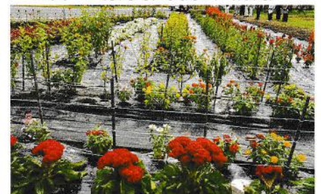
銀賞 北小倉長寿クラブ (三郷)