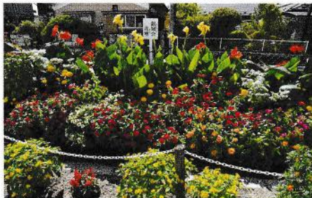
銀賞 アルプス区銀嶺会 (豊科)