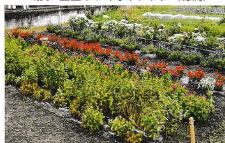
銅賞 下長尾寿楽会 (三郷)