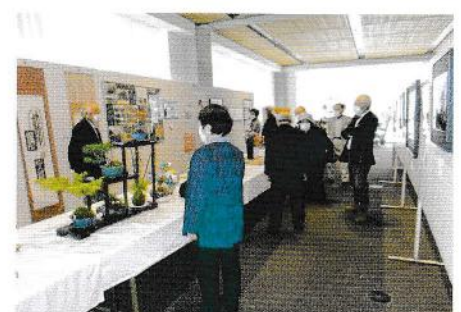
作品に見入る来場者