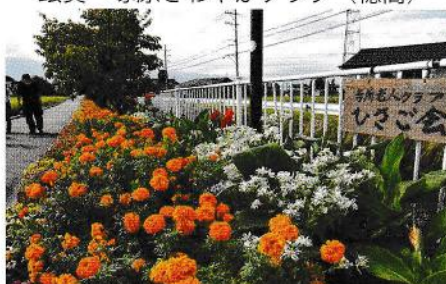
銅賞 寺所シニアクラブひさご会 (豊科)