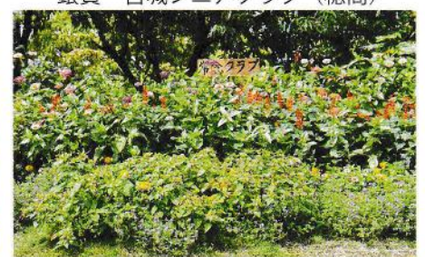
銅賞 常念クラブ (穂高)