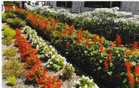
金賞 西原旭クラブ (穂高)