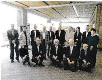
市長を囲んで記念写真