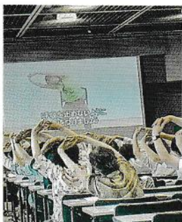
いきいきクラブ体操

最初に腹式呼吸を十回行いまず、パタカラ(唇と舌の運動)をメロディにあわせ歌ってみましょう。口腔機能が向上します。又、歌にあわせ両手の指を組みあわせたりほじいたり、腕を下したり、足踏みをしたり、自分の好きな童謡などを歌いながら、自由に行ってみてください。最後にいつもの「いきいきクラブ体操」を椅子に座ったまま行い、この日の研修を終了しました。