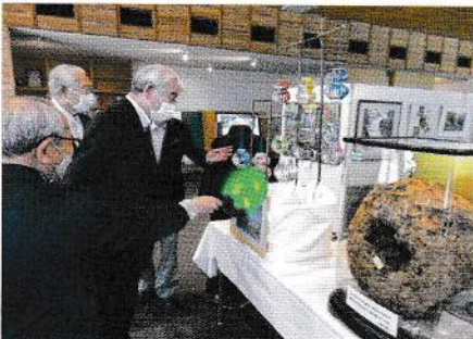
説明を受ける市長