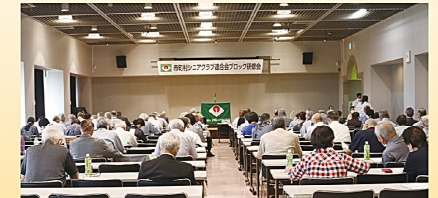
6月20日 市町村シニア連ブロック研修会