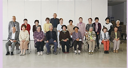
女性部長の皆さん