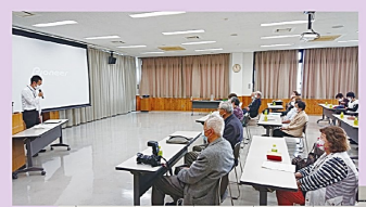
サギ予防講座の様子

女性部では、5月12日に単位クラブ女性部長会を開催しました。 今後の女性部の予定について話し合い、今年度の女性部研修旅行については、残念ながら開催を見送ることとなりました。 今後予定されている行事として長野県女性指導者研修会があります。 会の後半では、塩尻警察署、生活安全課の長根係長から「電話でお金サギ」に関する予防策について教えていただきました。