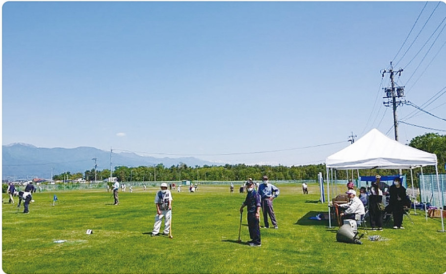
塩尻市友愛クラブ連合会 第 35 回グランドゴルフ大会 (令和 4 年 6 月 2 日)